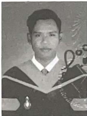
นายทะเบียนมหาวิทยาลัย