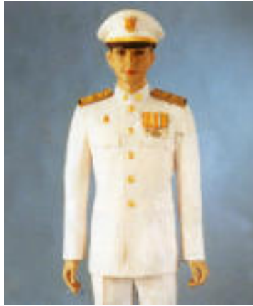
เครื่องแบบปกติขาว ระดับเหรียญ เครื่องราชอิสริยาภรณ์