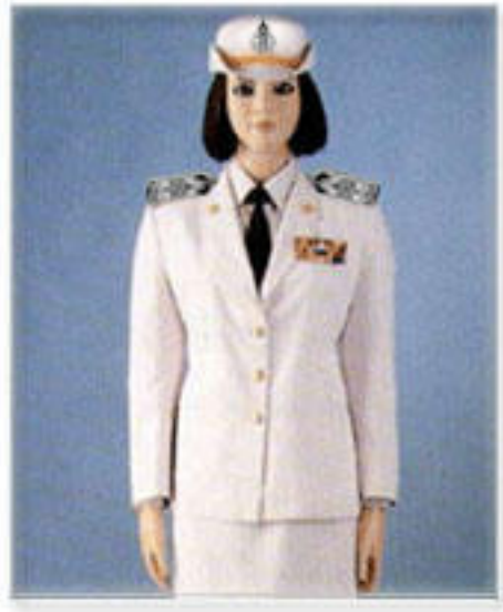
เครื่องแบบปกติขาว ระดับเครื่อง หมายแพรวแถบย่อ เครื่องราชอิสริยาภรณ์