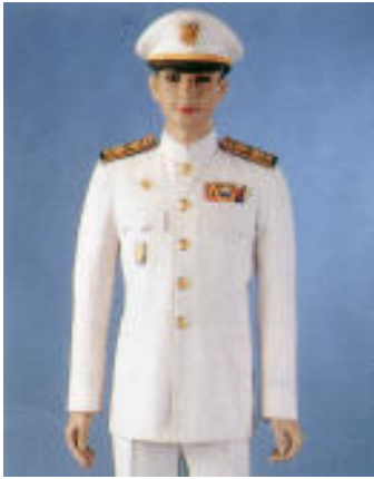
เครื่องแบบปกติขาว ระดับเครื่องหมาย แพรวแถบย่อ เครื่องราชอิสริยาภรณ์