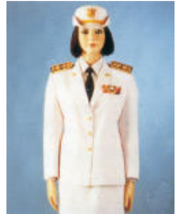
เครื่องแบบปกติขาว ระดับเครื่องหมาย แพรวแถบย่อ เครื่องราชอิสริยาภรณ์