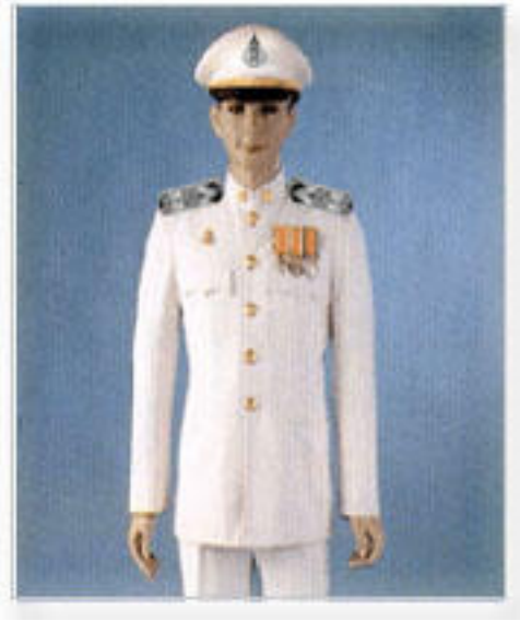
เครื่องแบบปกติขาว ระดับเหรียญ ราชอิสริยาภรณ์